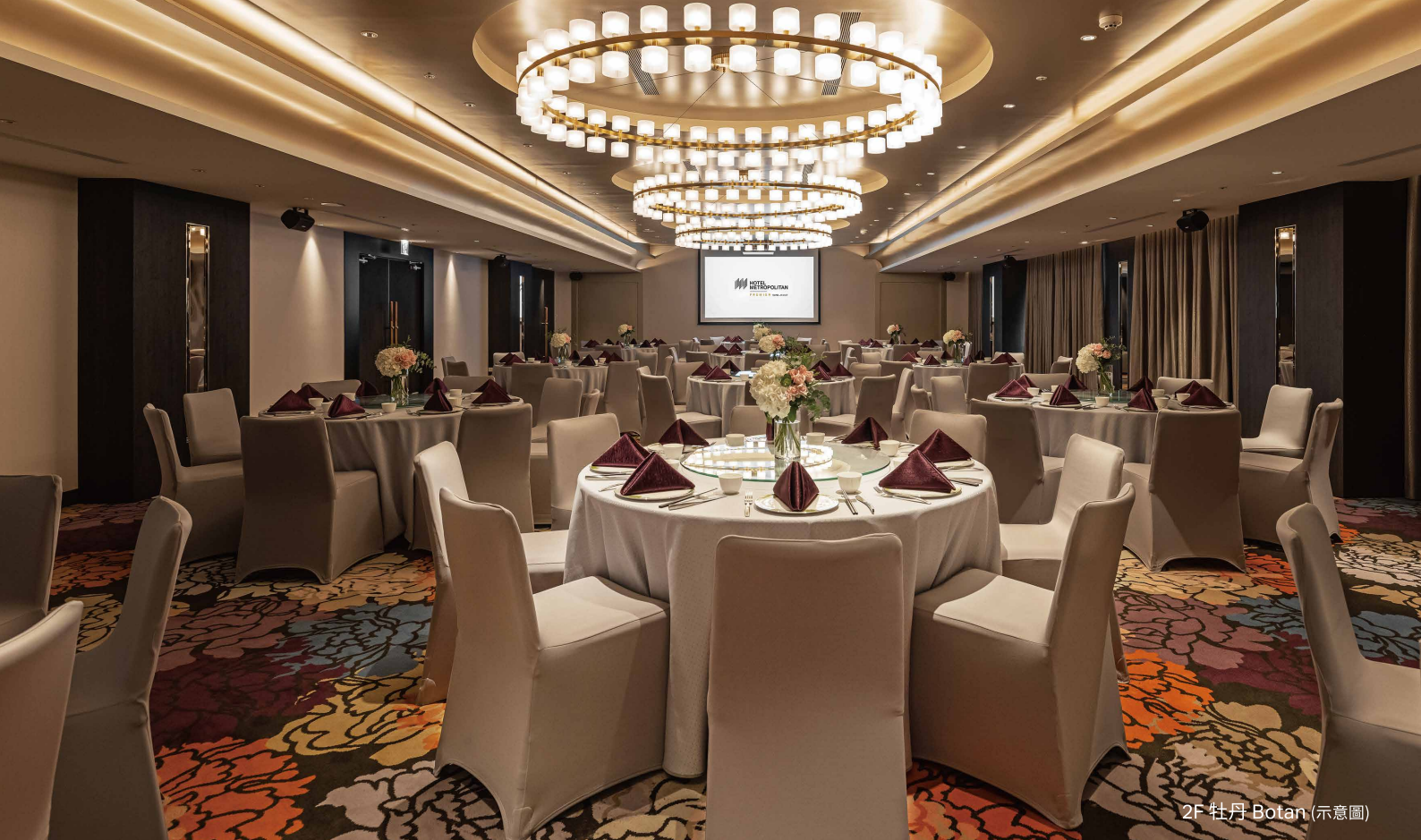
2F 牡丹 Botan (示意圖)